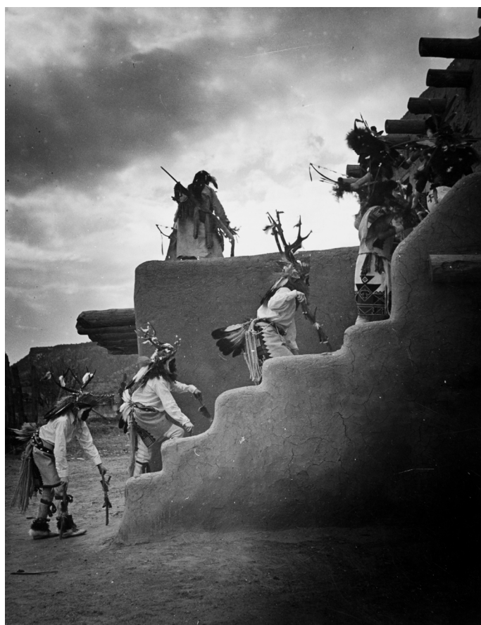
Deer Dance (Danse du cerf), San Ildefonso, Nouveau-Mexique, 1947

Rue des Minimes 21 Miniemenstraat 1000 Brussels