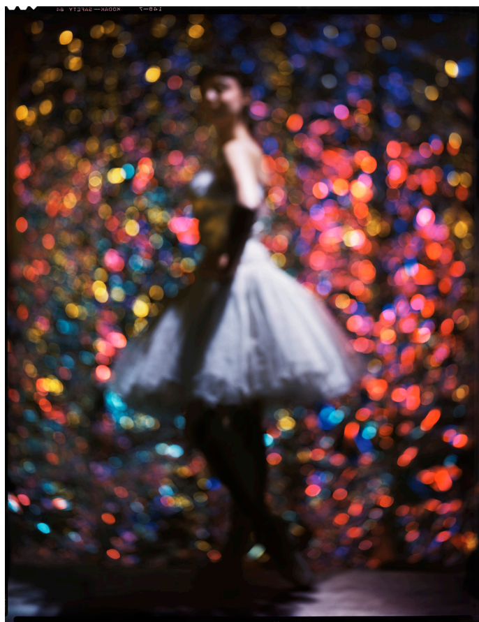
D'après Degas, New York, 1947, Coll. famille Blumenfeld

Citations artistiques. Paris, 1930 – New York, 1950