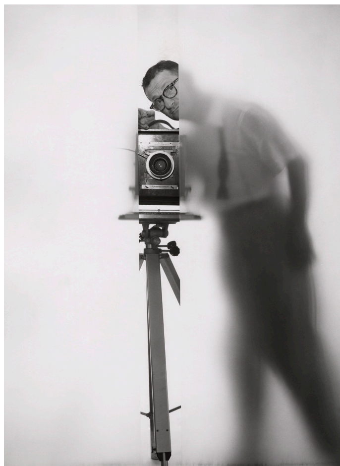
Autoportrait à l'appareil photographique Deardoff, New York, 1950-1955

Rue des Minimes 21 Miniemenstraat 1000 Brussels