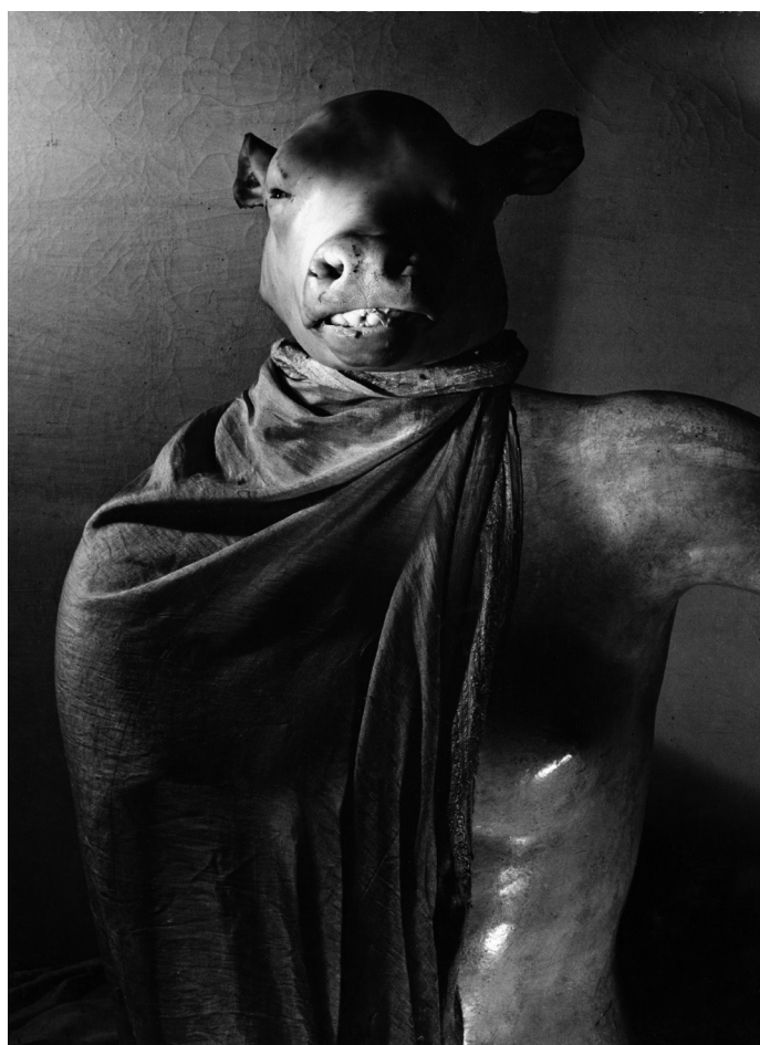
Le Minotaure ou Le Dictateur, Paris, 1937, Collection famille Blumenfeld

Le Dictateur. Amsterdam, 1933 – Paris, 1937