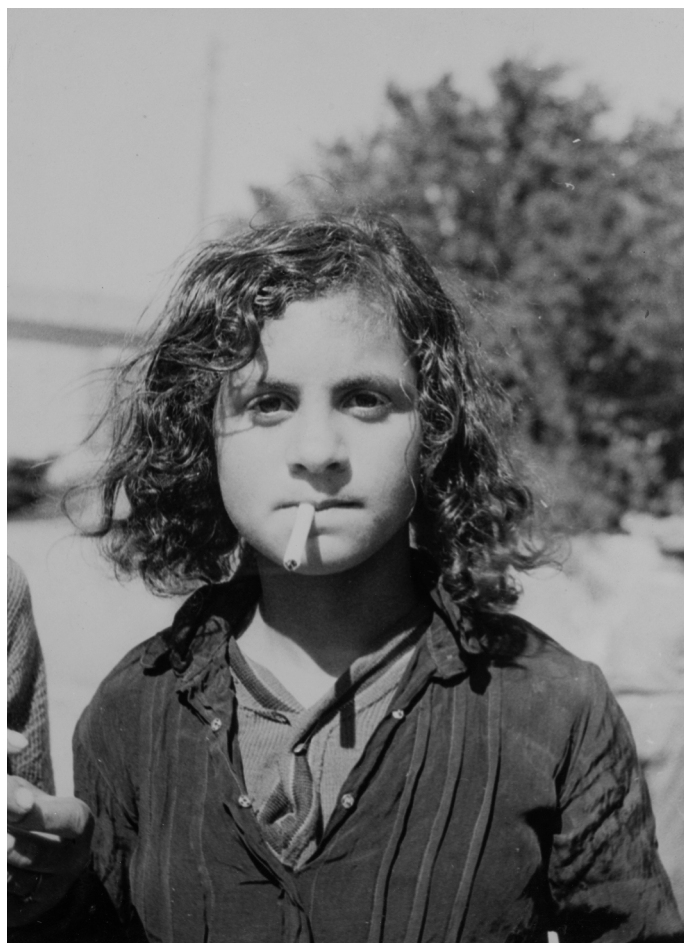
Sans titre , Saintes-Maries-de-la-Mer, vers 1928, Coll. famille Blumenfeld

Gitans. Saintes-Maries-de-la-Mer, 1928-1932